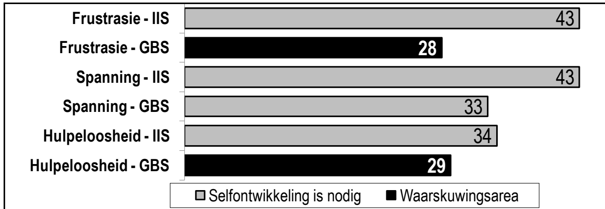
FIGUUR 2 NEGATIEWE PSIGOSOSIALE FUNKSIONERINGSAREA