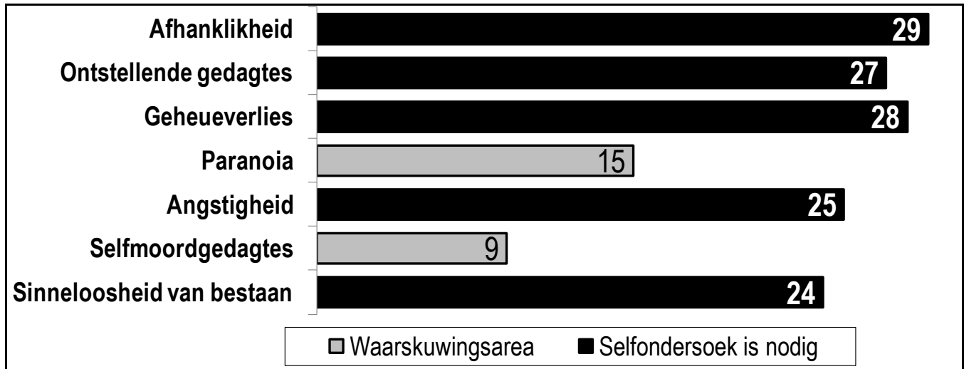
FIGUUR 3 EMOSIONELE FUNKSIONERING